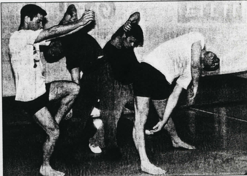
רקדני בת שבע בחורה. צפו להפתעות

"כמו נשיא המדינה, למשל. מבחינת, יש פה ניסיון לקחת מארז מלבתי ובובמבסטי. במופע אני מפגיש כל מיני קצוות. אני נוגע בממלכתי, ומשתמש