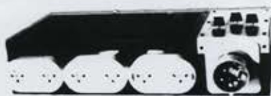
מערכת ניידת כולל פיקוד