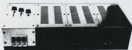
מערכת ניידת כולל פיקוד