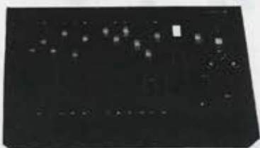
לוח פיקוד 12 ערוצים 2 תמונות