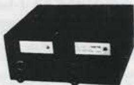
יחידת הספק 2x4KVA