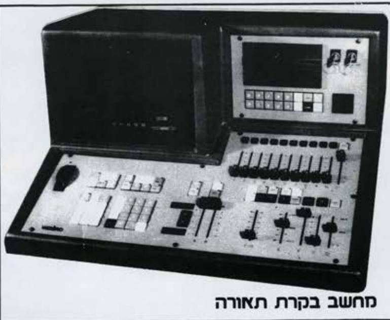
מחשב בקרת תאורה

אחריות על תיקונים ורכיבים לשנה. מעבדת שרות לתקונים דחופים. שרות מייד.