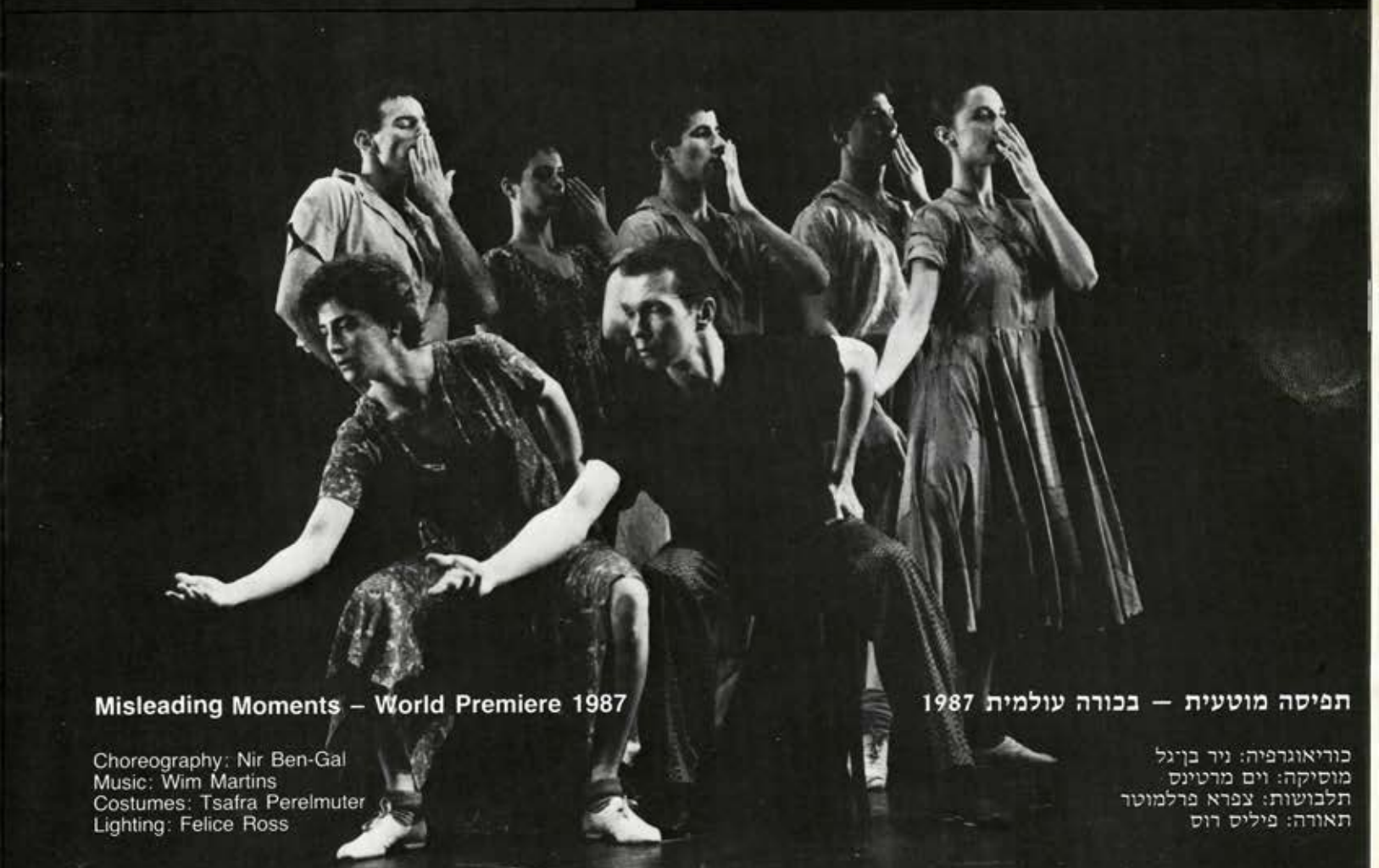
Misleading Moments – World Premiere 1987