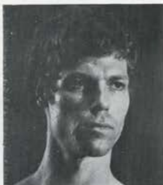
Ohad Naharin אוהד נהרין